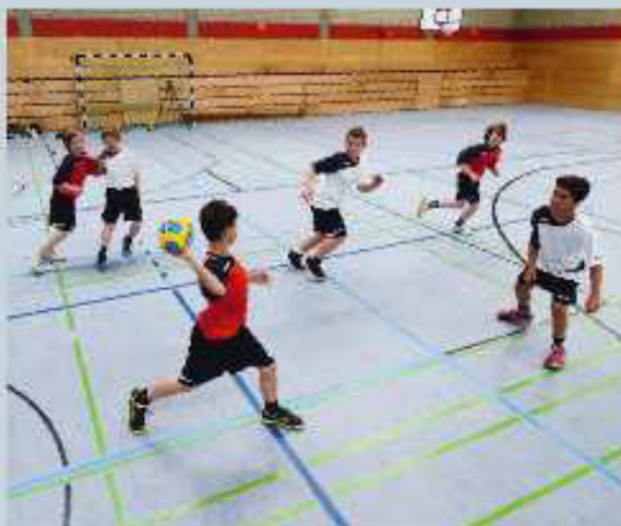
Das Freilaufen in der Manndeckung ist ein wesentlicher Ausbildungsschwerpunkt zur Entwicklung der Spielfähigkeit der Kinder in der E- und D-Jugend.

Die taktische Schulung einer bestimmten Abwehrformation ist untergeordnetes Ziel.