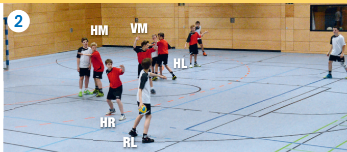
HR schirmt offensiv die Wurfarmseite des RL ab, HL und HM decken beide Kreisspieler, VM agiert defensiver im diagonalen Passweg von RL zu KR.