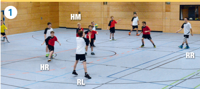
RR passt zu RL: HR muss RL offensiv angreifen, HM muss in Richtung des linken Kreisspielers sprinten.