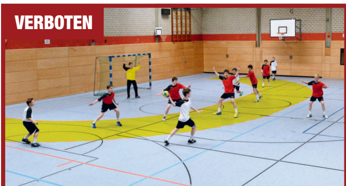
Fünf Abwehrspieler agieren deutlich in der Nahwurfzone. Diese 5:1-Abwehr ist nicht erlaubt.