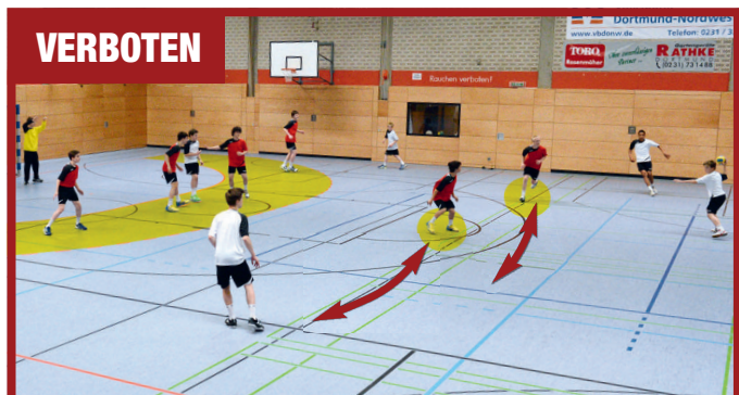
Eine 4:2-Abwehr, in der nur zwei Abwehrspieler außerhalb der Nahwurfzone agieren, ist verboten.