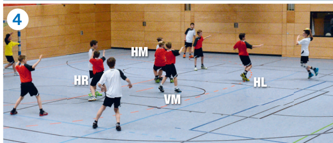
HL läuft offensiv gegen RR heraus, HR und HM schirmen beide Kreisspieler ab, VM agiert wieder im diagonalen Passweg von RR zu KL.