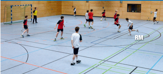
Die Abwehr agiert in einer 3:3-Abwehr (2-Linien-Abwehr). RM läuft ohne Ball in Richtung Nahwurfzone.