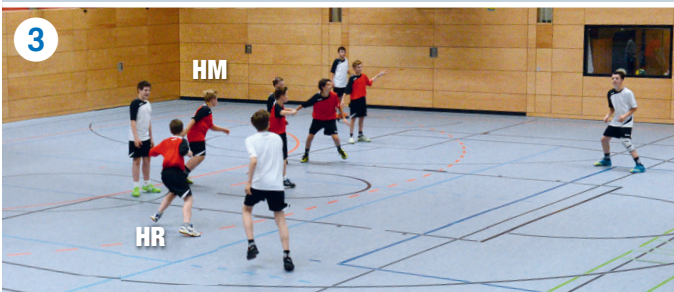
Rückpass zu RR: HM muss wieder zum rechten Kreisspieler sprinten, HR läuft zurück und übernimmt den linken Kreisspieler.